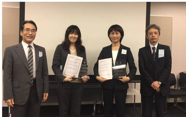
辻支部長（左），賞状を授与された受賞者（中央）と中山選考委員